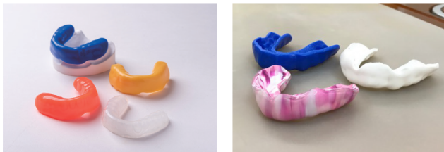
▲ スポーツマウスガードは自身のケガを防止するだけでなく相手のケガを防ぐこともできる

スポーツマウスガードは、スポーツ時のケガの防止が目的の保護装置です。アメリカンフットボールやボクシングでは、スポーツマウスガードの着用が国際的に義務付けられているなど、スポーツ時の必要性が高まってきました。それに伴い、使用者も増加しています。市販のスポーツマウスガードは比較的安価ですがすぐに手に入りますが、つけ心地が悪い、歯を痛めてしまうなどのデメリットがあります。歯科医院で作るスポーツマウスガードは、自分の歯の形にぴったりと合うように一つ一つカスタマイズして設計されており、快適で安全に装着できます。特に、歯が折れる、抜ける、ぐらつく、唇・舌・粘膜の裂傷（自分の歯で唇を切る、ひどい時は唇から歯が飛び出す）、顎の骨にヒビが入る、顎の骨が折れるといった歯や顎の外傷予防や脳震盪（のうしんとう）の防止・軽減につながります。